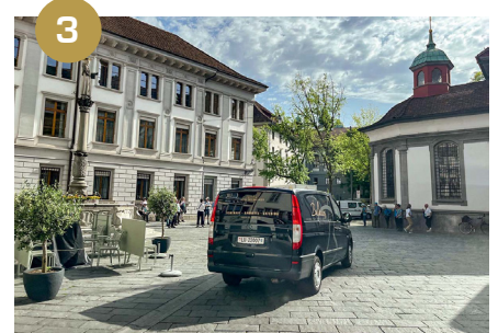
3 Traversez complètement la place