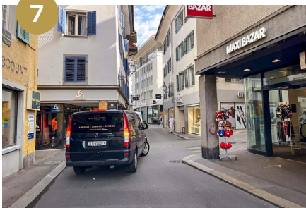
7 La 1ère rue à droite vous mène directement ...