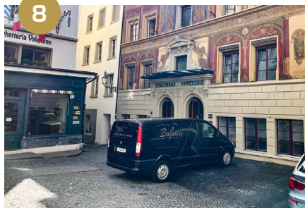
8 ...en face de l'Hôtel des Balances au «Weinmarkt»