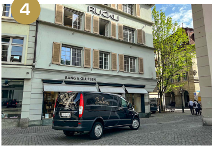
4 Tournez à droite dans la petite rue