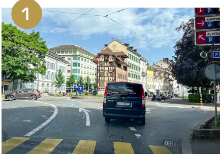
1 Tourner à droite dans la rue en face du parking Kesselturm