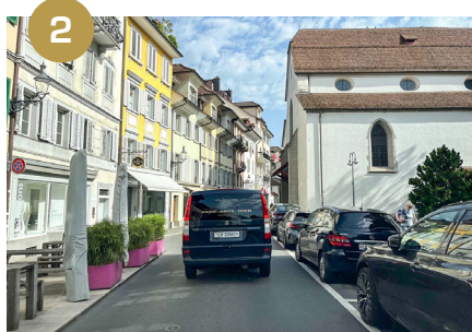
2 Continuer tout droit jusqu'à Franziskanerplatz