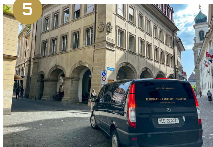
5 Première rue tourner à gauche dans la zone piétonne